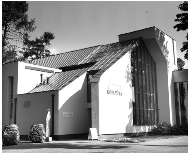
Anykščių koplyčia - populiarus vestuvių vieta dėl gražios erdvės.

Numatoma, kad pakeitimai įsigalios nuo liepos 10 dienos.