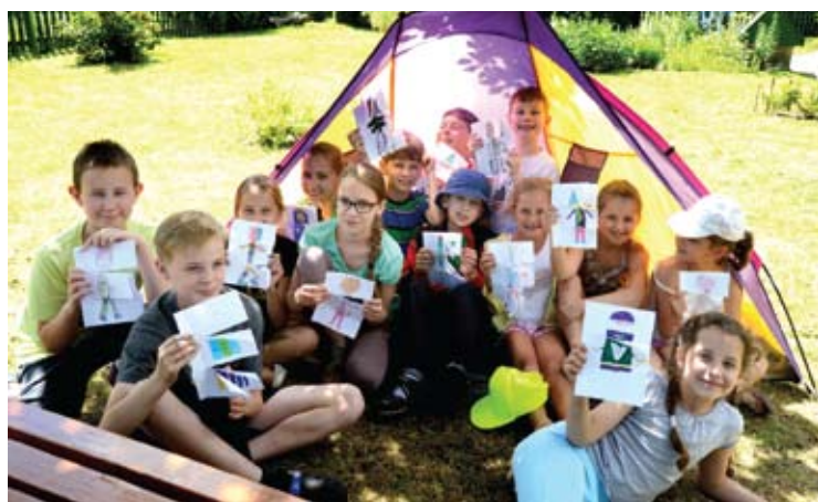
Vaikai pasidarė vaizdaknygių.