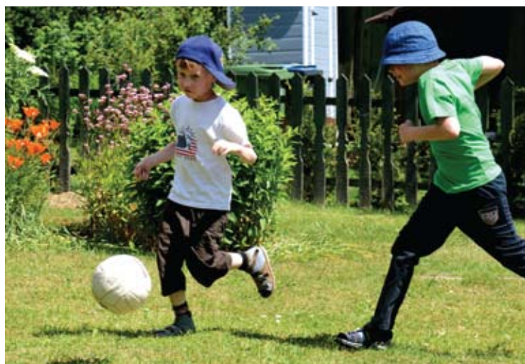
Smagu bėgioti po rašytojos kiemelį.