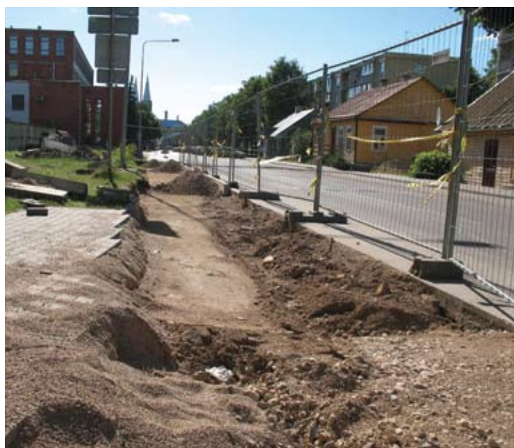
Anykščių S.Dariaus ir S. Girėno gatve mašinos riedės per begalvį žmogus kūną...

Praėjo kone mėnuo, kai šalia „Anykščių vyno“ gamyklos buvo atkasti žmogaus griaučiai. Tiksliau, tik kaukolė. Griaučių likimas vis dar nėra aiškus: kaukolę ištirti rajono policija perdavė teismo medicinos ekspertams, o likęs kūnas ten, kur ir buvo rastas – po asfaltu.