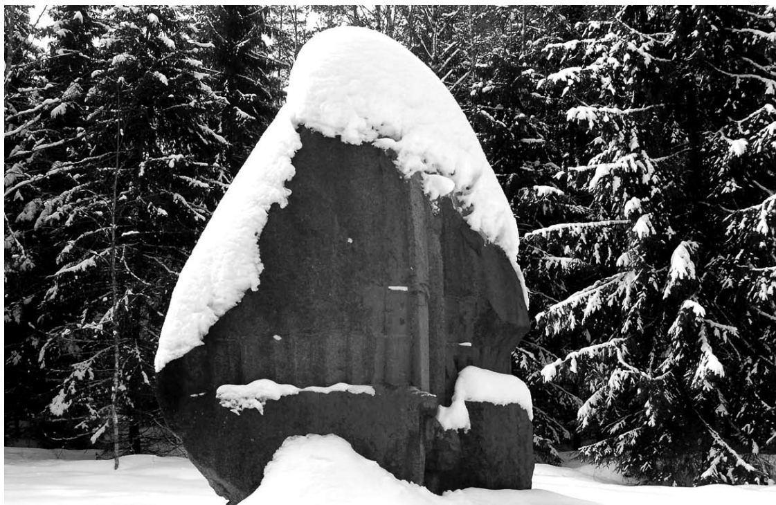
Sukilėlių stovyklos vietą Teresbore dabar žymi paminklinis akmuo.