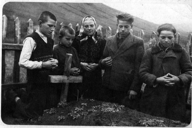
Tremtinių laidotuvės Krasnojarsko krašte.

Tarybinė visuomenė pati humaniškesnė, čia kiekvienas saugomas, globojamas, nėra neteisybės, nedarbo ir kitų buržuazinių blogybių. Taip ilgą laiką buvo kalama okupuotos Lietuvos gyventojams. Šį kartą apie temą, kuri nebuvo minima tarybinio laikotarpio - tremtį.