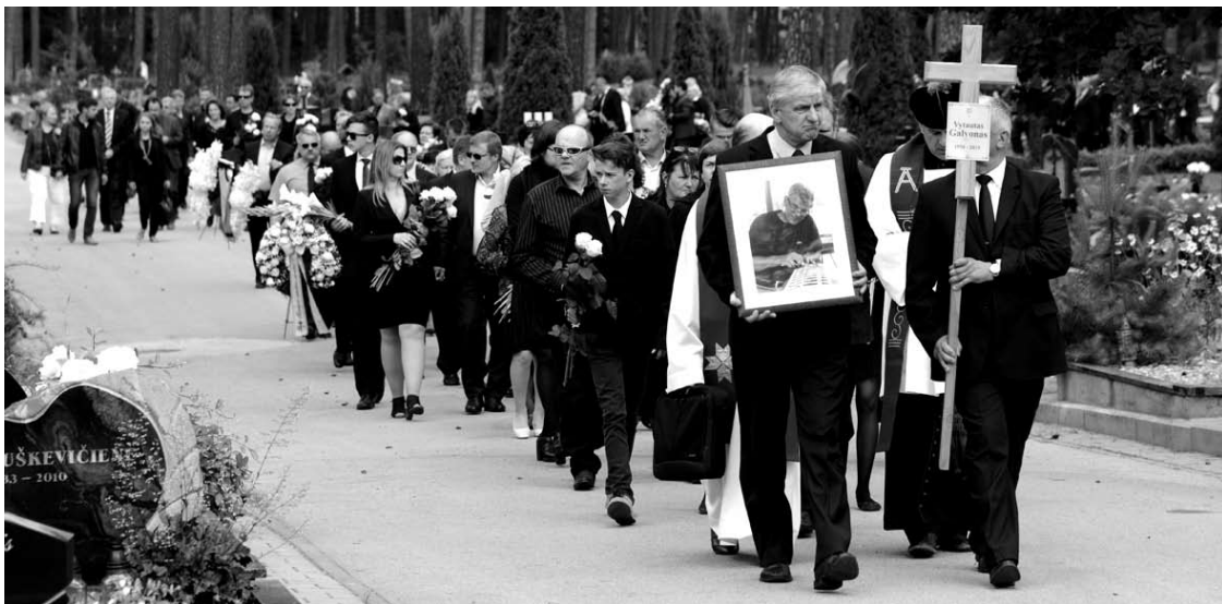
Laidotuvių procesija Kairėnų kapinėse.